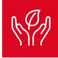
Umwelt > Seite 6