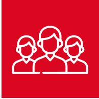
Activités et compétences > page 4