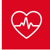
Santé et sécurité > page 5