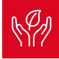
Environnement > page 6